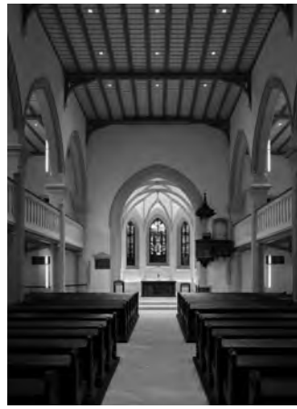
EVANGELISCHE KIRCHE LINKENHEIM