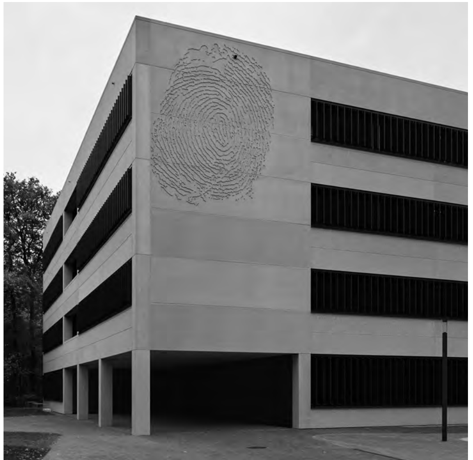
Eingangsfassade mit „Fingerprint“

wurde die mit Betonfertigteilen verkleidete Fassade jedoch in ein zeitgemäßes Gestaltungsbild transformiert. Die roten, lichtdurchlässigen Vertikallamellen vor den Fensterbändern bilden einen starken Kontrast zu den grauen Betonflächen und verleihen der Fassade einen eigenen Charakter. Sie dienen dem Sonnenschutz und tragen dazu bei, dass sich das Gebäude nicht zu stark über die Fassade aufheizt.