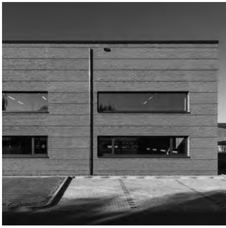
Fassade aus Vormauerwerk, durch Lisenen dezent gegliedert