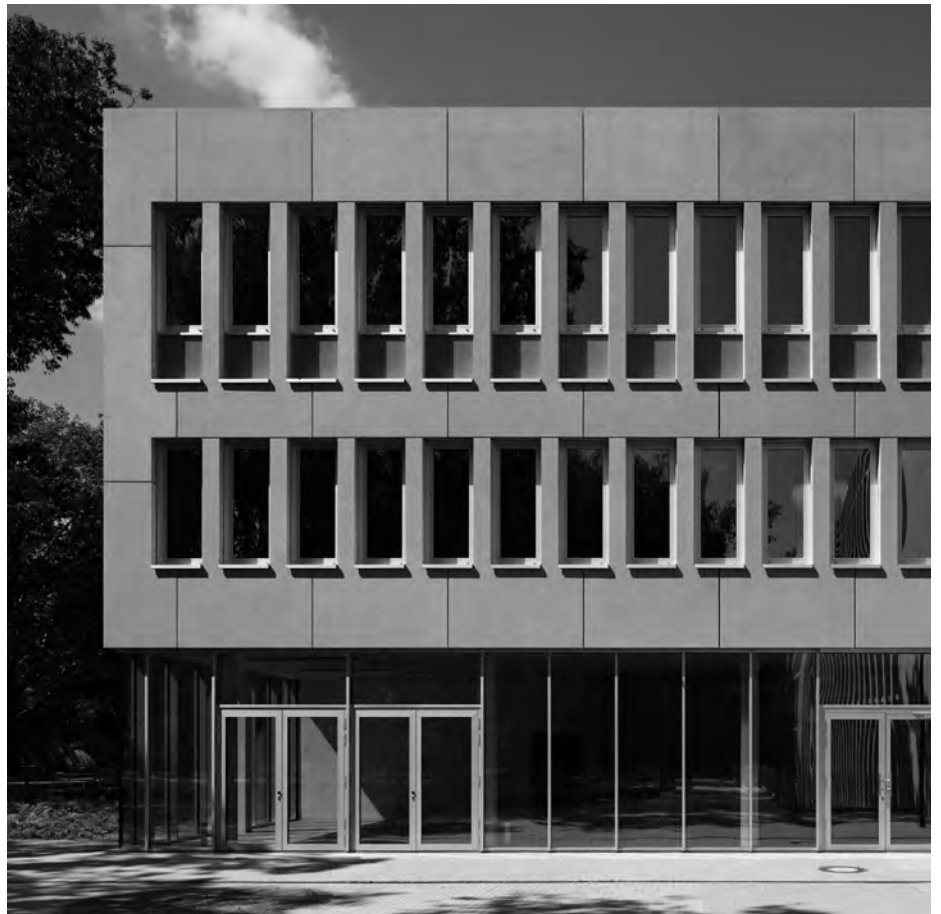
Blick auf das Foyer mit Hörsaal

Eine großflächige Verglasung im Erdgeschoss vermittelt zwischen innen und außen. Sie führt in den Hörsaal-, Foyer- und Kommunikationsbereich, wo neben der Förderung der Kommunikation Themen wie Adressbildung und gute Orientierbarkeit im Vordergrund stehen. Das Foyer mit studentischen Arbeitsplätzen und Servicepoint orientiert sich zum Außenbereich und schafft einen Ort der Kommunikation, der auch von den Ein- und Ausblicken lebt.