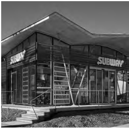
Fassade und Dachfaltwerk