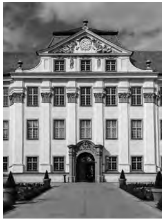
NEUES SCHLOSS TETT NANG