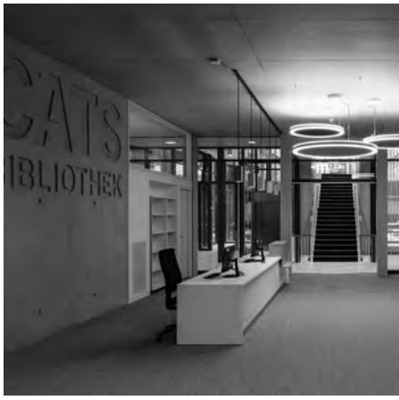
Ausleihe der Bibliothek im Neubau