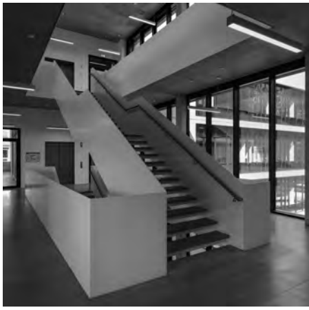
Freitreppe im Foyer