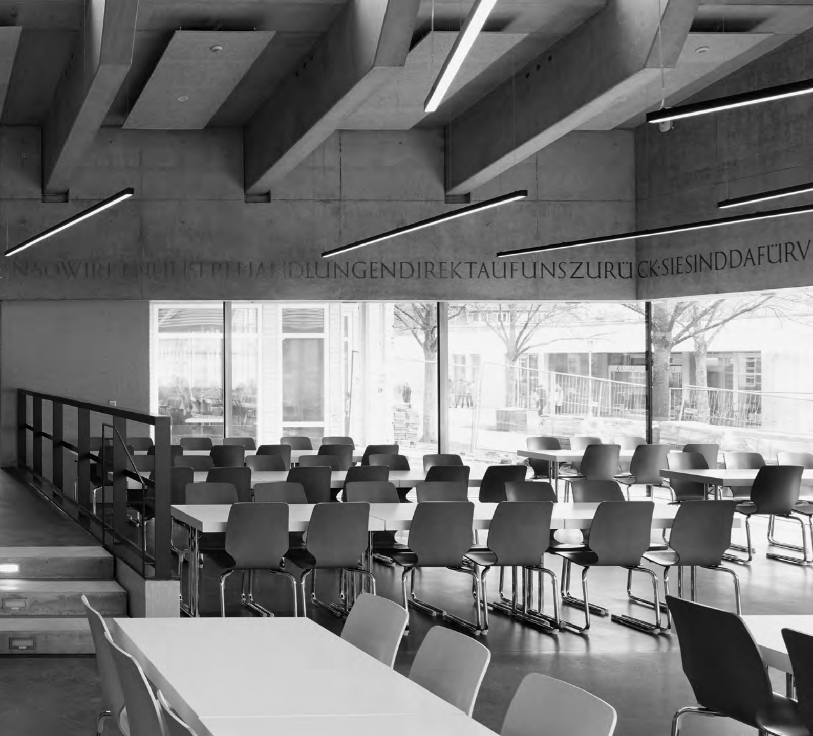
Speisesaal mit Textfries