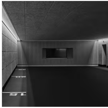
Blick in die Schießbahn