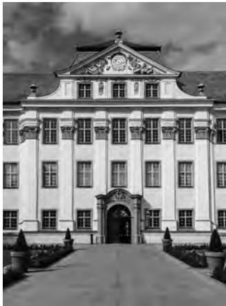
KURZ UND BÜNDIG S.06

Erweiterung der Mensa Universität Hohenheim