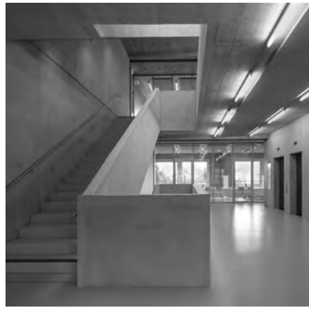
Blick in den offenen Treppenraum