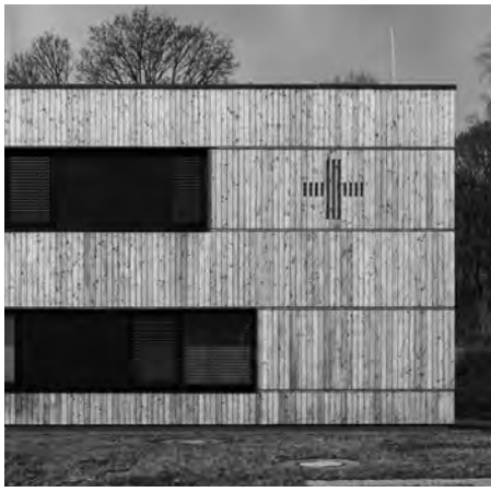
feingliedrige Holzverschalung mit filigraner Ausgestaltung der Fensteröffnungen