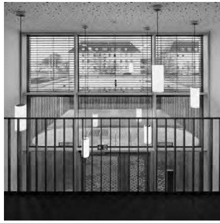
Blick aus dem zweigeschossigen Foyer auf den Exerzierplatz