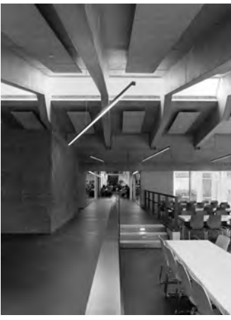
GEPLANT UND GEBAUT S.10

Erweiterung der Mensa Universität Hohenheim