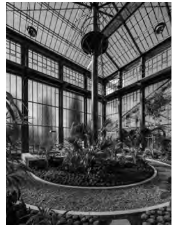
BOTANISCHER GARTEN KARLSRUHE