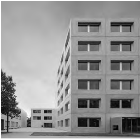
Westansicht des Ensembles