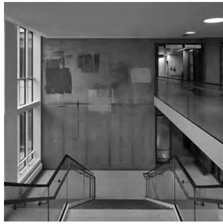
Foyer mit Kunst auf Sichtbetonwand