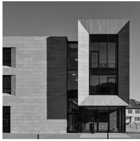
der Haupteingang - städtebaulich prägnanter Kopfbau