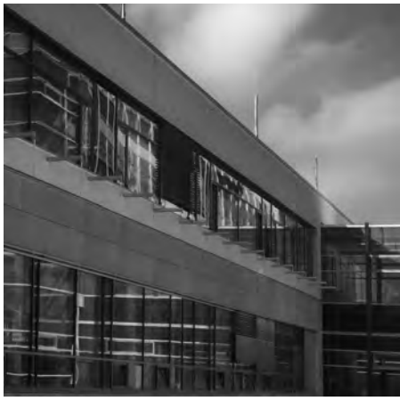
Blick auf die Nordfassade des aufgestockten Funktionsbaus