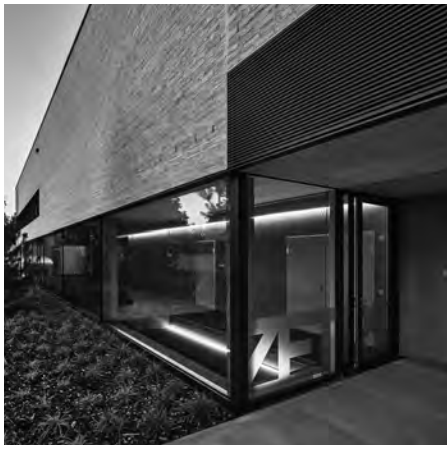
Eingang vom Polizeihof