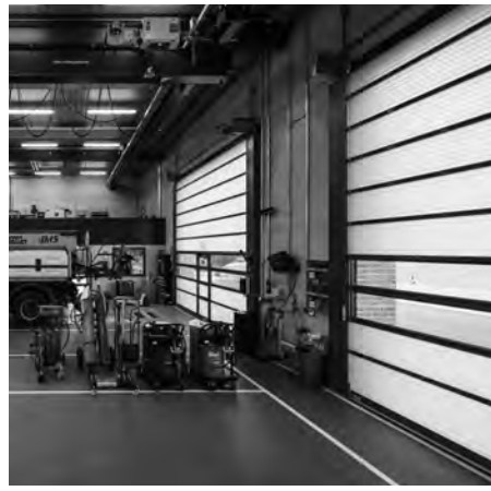
schlichte Materialität und transluzente Tore – sachliche Werkstattatmosphäre